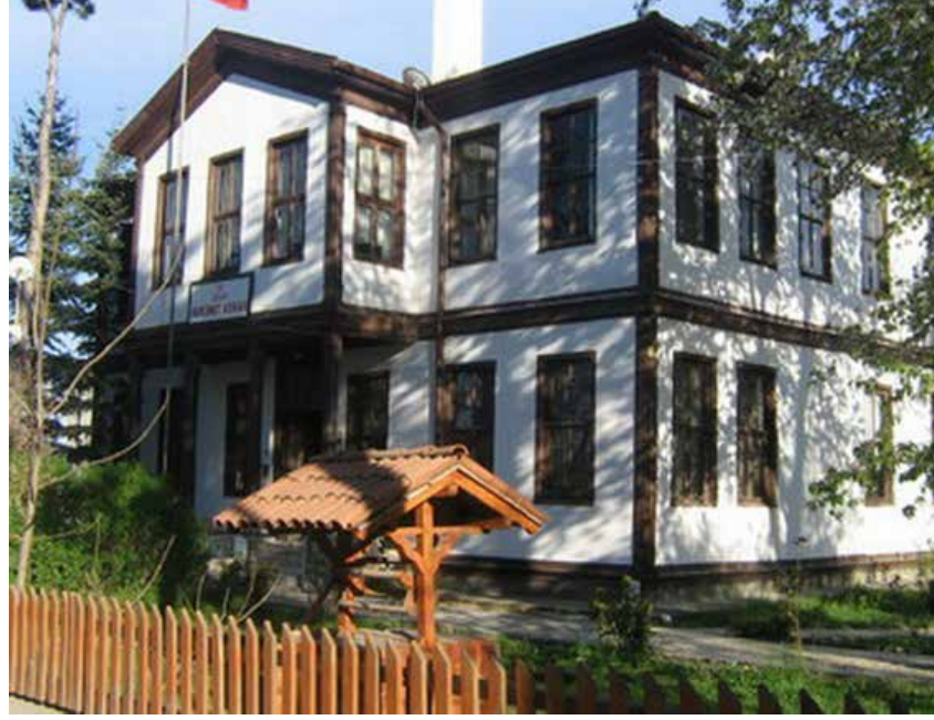
Eski Hükümet Konağı

Çalışmada emeği geçenlere çok teşekkür ediyor, çalışmanın Daday'ın tanıtımı ve markalaşması adına hayırlı olmasını diliyorum.