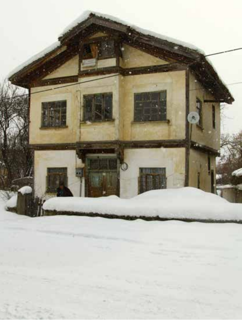
Güvercinler kış mevsiminin sesi ve nefesi olur sokaklarda...