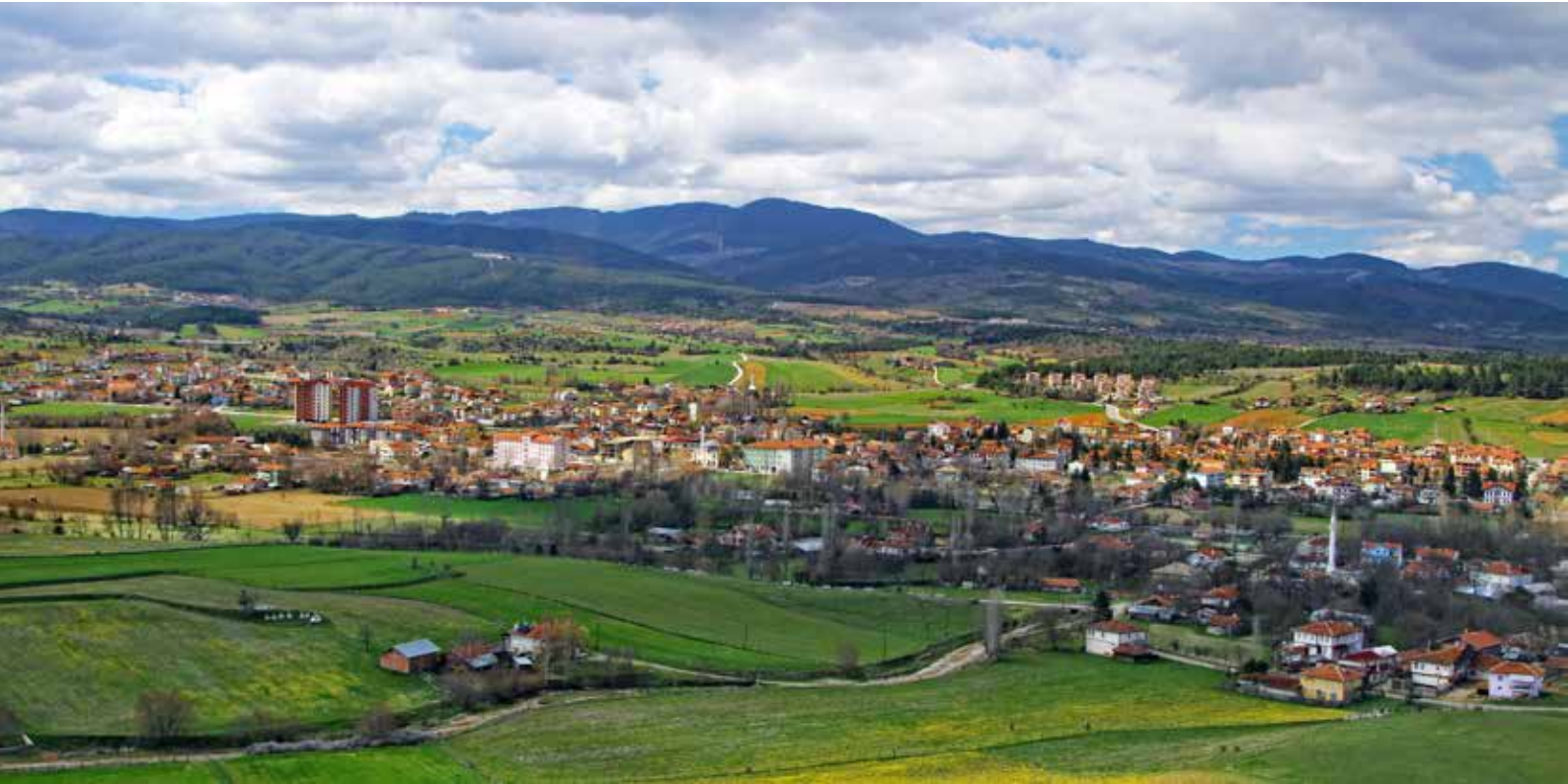
Daday'dan genel görünüm...